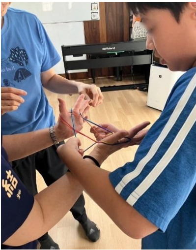
あやとりで指先訓練！