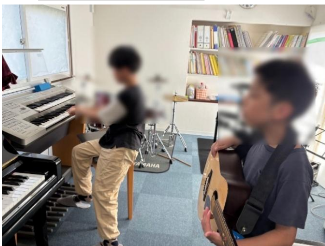
2人で即興アンサンブル！！