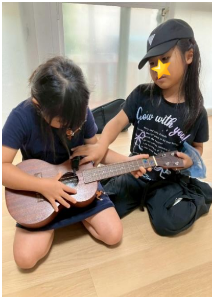
こども同士で教え合い

毎日、子ども達のニーズに答えながら楽しい音楽療育を展開しています。 お友だち同士の交流が成長の大きな原動力になっています♪