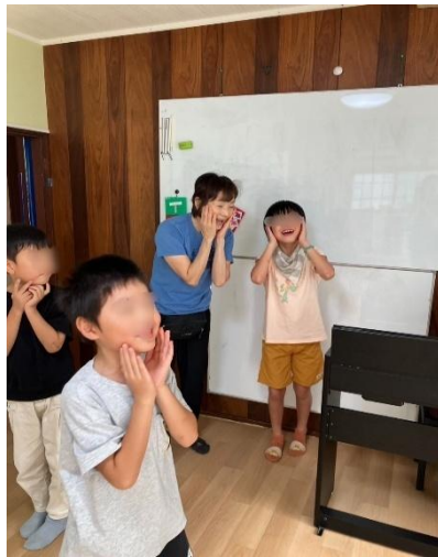
模倣してボディイメージ