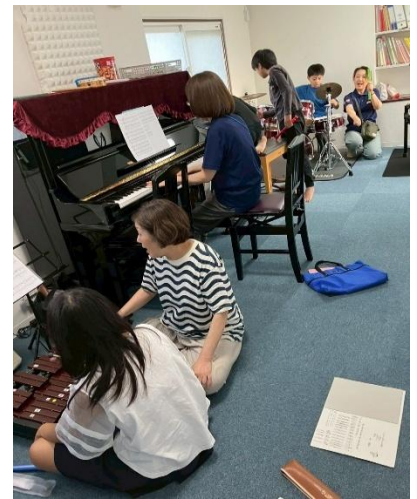
土曜日アンサンブル